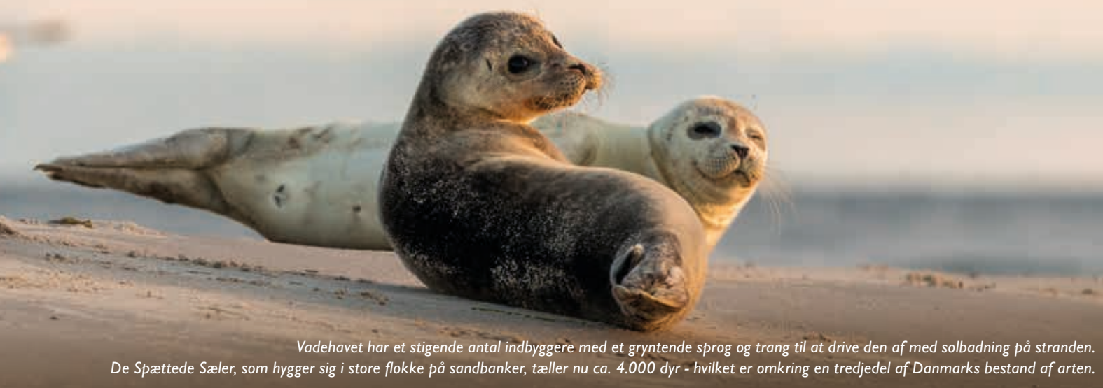
Vadehavet har et stigende antal indbyggere med et gryntende sprog og trang til at drive den af med solbadning på stranden. De Spættede Sæler, som hygger sig i store flokke på sandbanker, tæller nu ca. 4.000 dyr - hvilket er omkring en tredjedel af Danmarks bestand af arten.