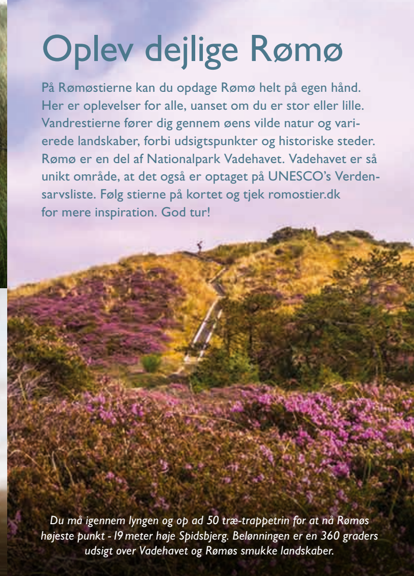
Du må igennem lyngen og op ad 50 træ-trappetrin for at nå Rømons højeste punkt - 19 meter høje Spidsbjerg. Belønningen er en 360 graders udsigt over Vadehavet og Rømons smukke landskaber.