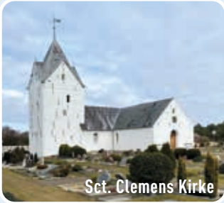
Sct. Clemens Kirke