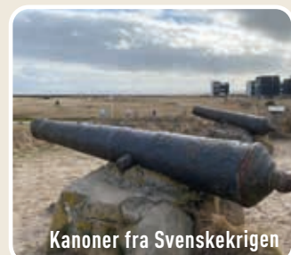
Kanoner fra Svenskekrigen