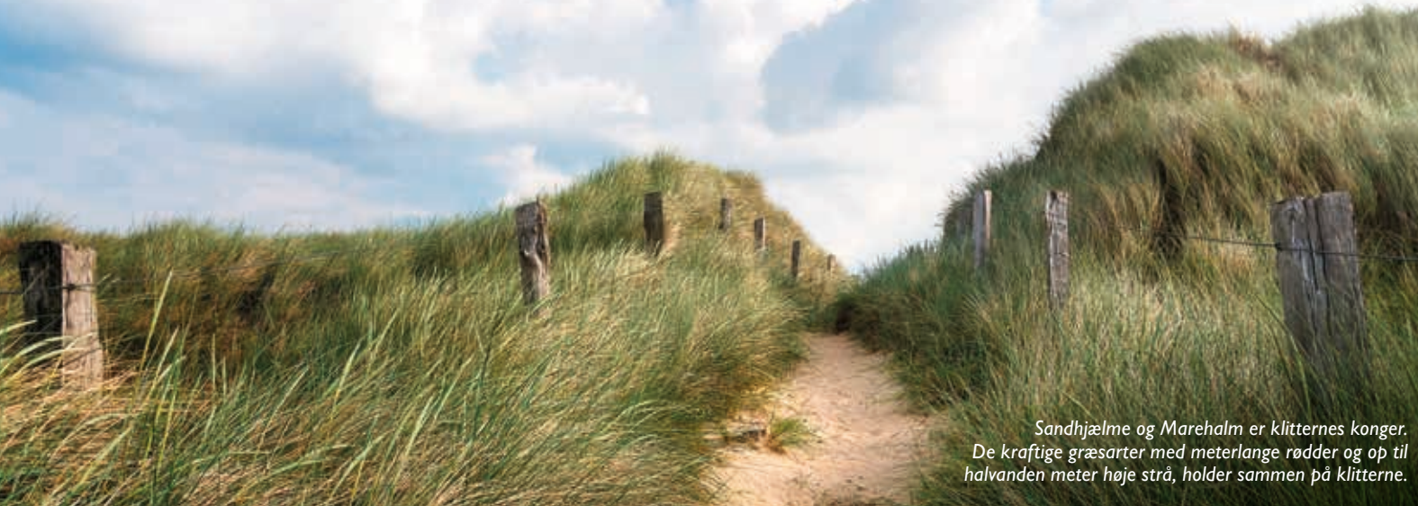
Sandhjælme og Marehalm er klitternes konger. De kraftige græsarter med meterlange rødder og op til halvanden meter høje strå, holder sammen på klitterne.