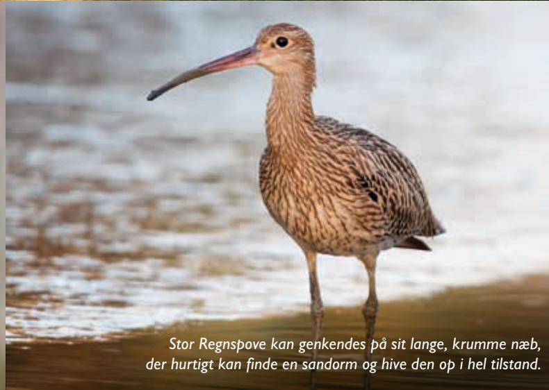
Stor Regnspove kan genkendes på sit lange, krumme næb, der hurtigt kan finde en sandorm og hive den op i hel tilstand.