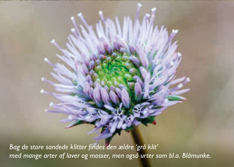
Bag de store sandede klitter findes den ældre 'grå klit' med mange arter af laver og mosser, men også urter som bl.a. Blåmunke.

På Rømostierne kan du opdage Rømø helt på egen hånd. Her er oplevelser for alle, uanset om du er stor eller lille. Vandrestierne fører dig gennem øens vilde natur og varierede landskaber, forbi udsigtspunkter og historiske steder. Rømø er en del af Nationalpark Vadehavet. Vadehavet er så unikt område, at det også er optaget på UNESCO's Verdensarvsliste. Følg stierne på kortet og tjek romostier.dk for mere inspiration. God tur!