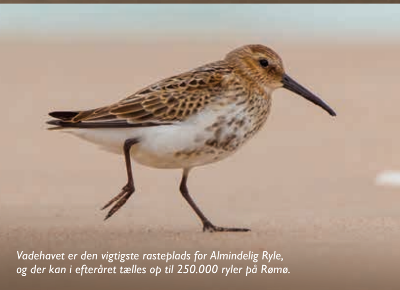
Vadehavet er den vigtigste rasteplass for Almindelig Ryle, og der kan i efteråret tælles op til 250.000 ryler på Rømø.