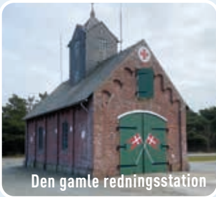
Den gamle redningsstation