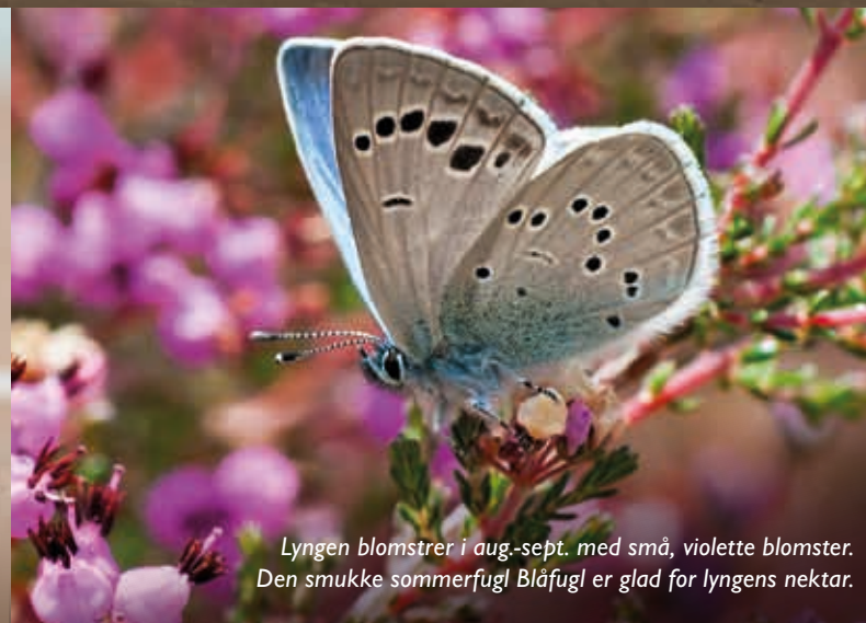
Lyngen blomstrer i aug.-sept. med små, violette blomster. Den smukke sommerfugl Blåfugl er glad for lyngens nektar.